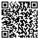
S410 3D demo